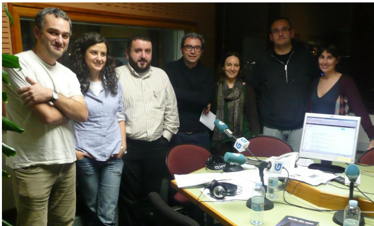
Parte do equipo efervescente

E mentres tanto poderedes gozar con «Efervescencia de verán» na sintonía da Radio Galega. O mellor e máis refrescante de toda a tempada os sábados de 4 a 5 da tarde, e os domingos a mesma hora (mentres non empece o fútbol). Non volo perdades.